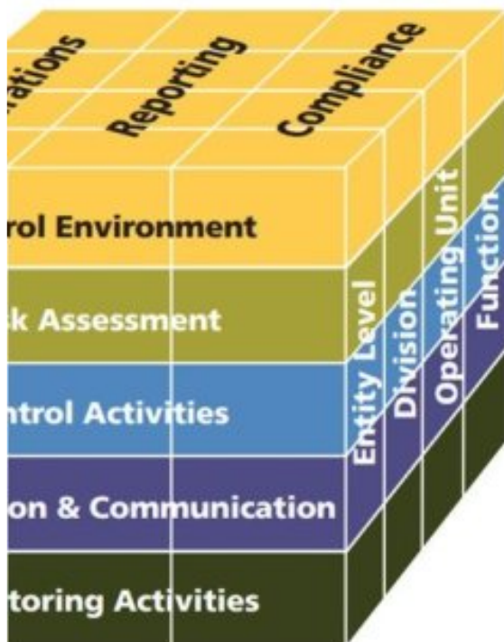
Table 2: 17 Principles

Here are the titles of the 17 internal control principles by internal control component as presented in COSO's 2013 Framework: